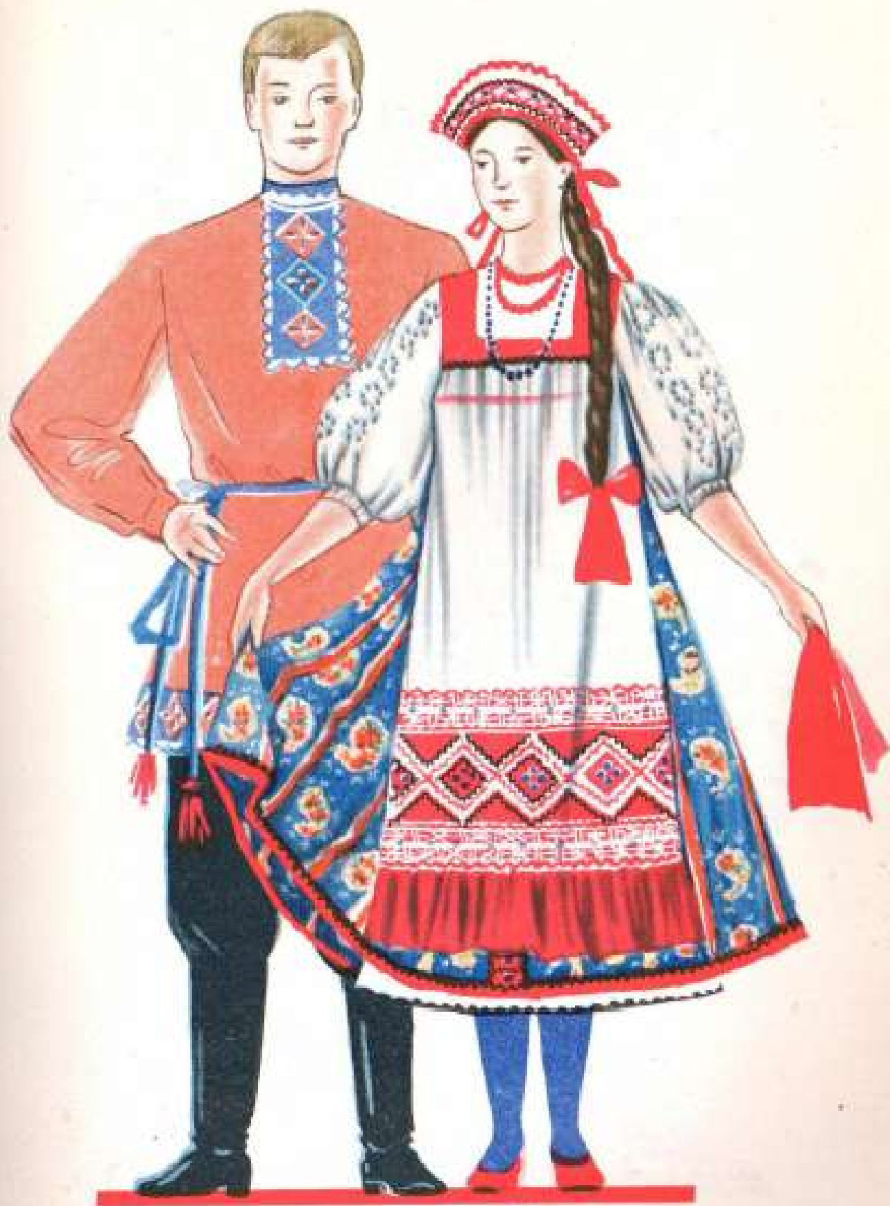
11. Старинные русские костюмы для танца