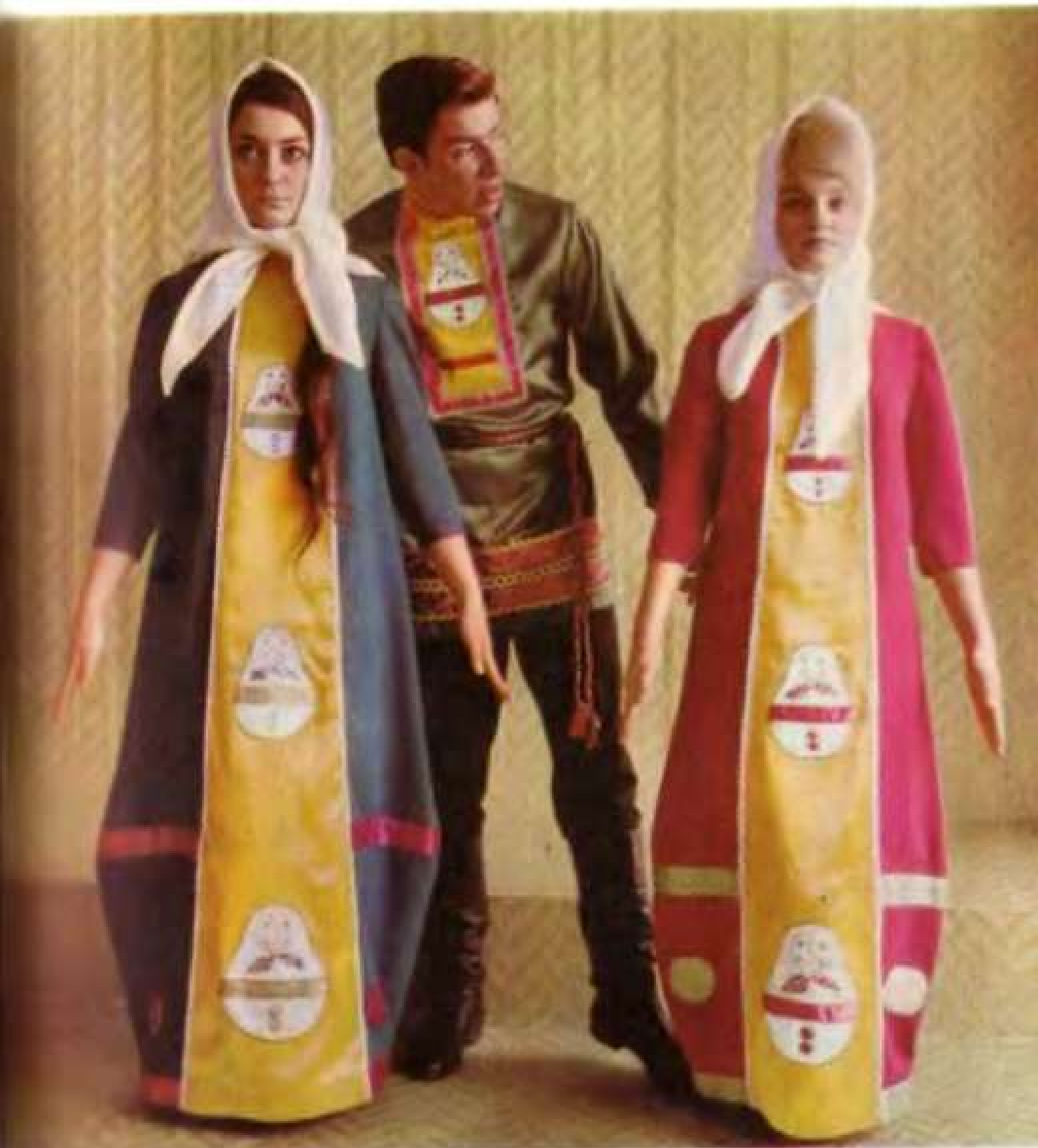
Вкладка 43. Костюмы для танца «Матрешки»