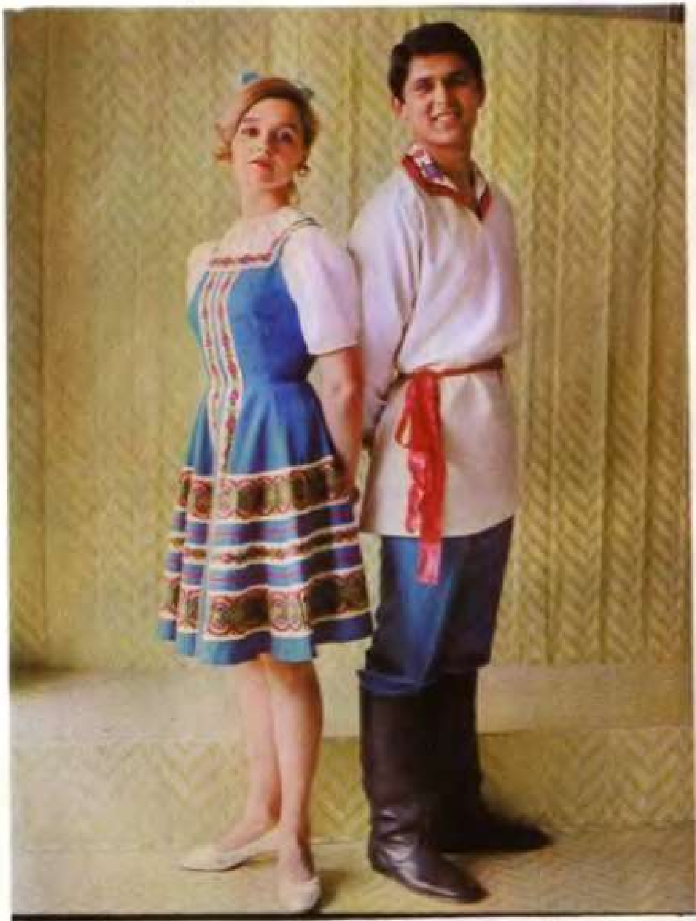
Вкладка 30. Молодежные танцевальные костюмы